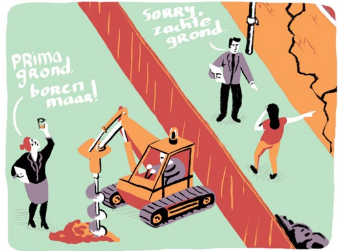
Onafhankelijkheid en veiligheid